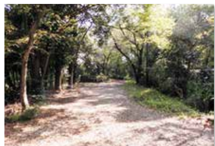
八王子は生糸の集積地。八王子から横浜の港へは絹の道を使って人力で運ばれていました(写真左:絹の道資料館/写真右:残されている絹の道)