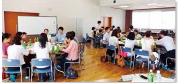
女性比率の高いWS会議。 テーブル毎に多くの現実的な意見が集められました。