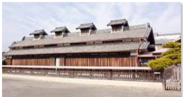
競進社(埼玉県・本庄市)