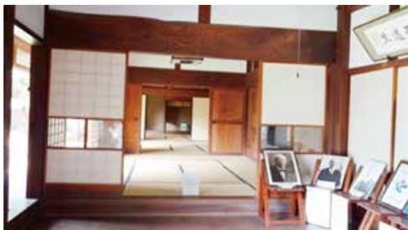
渋沢栄一一家・中の家の内部展示 (埼玉県・深谷市)